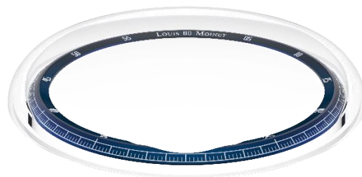
Rehaut intégré sous une glace tout en courbe