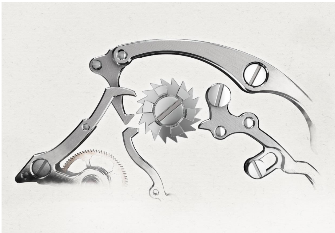
La roue à colonnes orchestre les différentes fonctions de Memoris Spirit

MEMORIS SPIRIT enrichit la famille Memoris en proposant un produit sophistiqué à une nouvelle clientèle. Cette création est importante autant pour des hommes que pour des femmes à la recherche d'un produit emblématique tout en restant soucieux d'élégance.