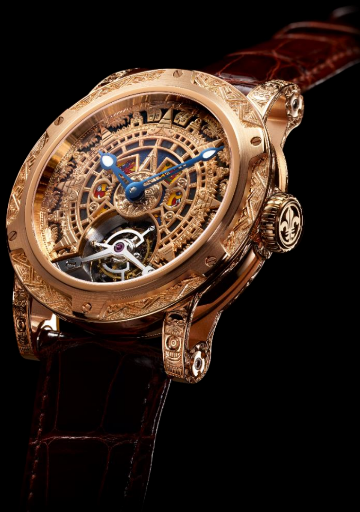
LM-44.50.ME Pièce unique, Numéro 01/01

Les Ateliers Louis Moinet SA Rue du Temple 1, P.O. Box 28 – CH-2072 Saint-Blaise NE – Tel +41 32 753 68 14 – Fax +41 32 753 68 16 presse@louismoinet.com – www.louismoinet.com