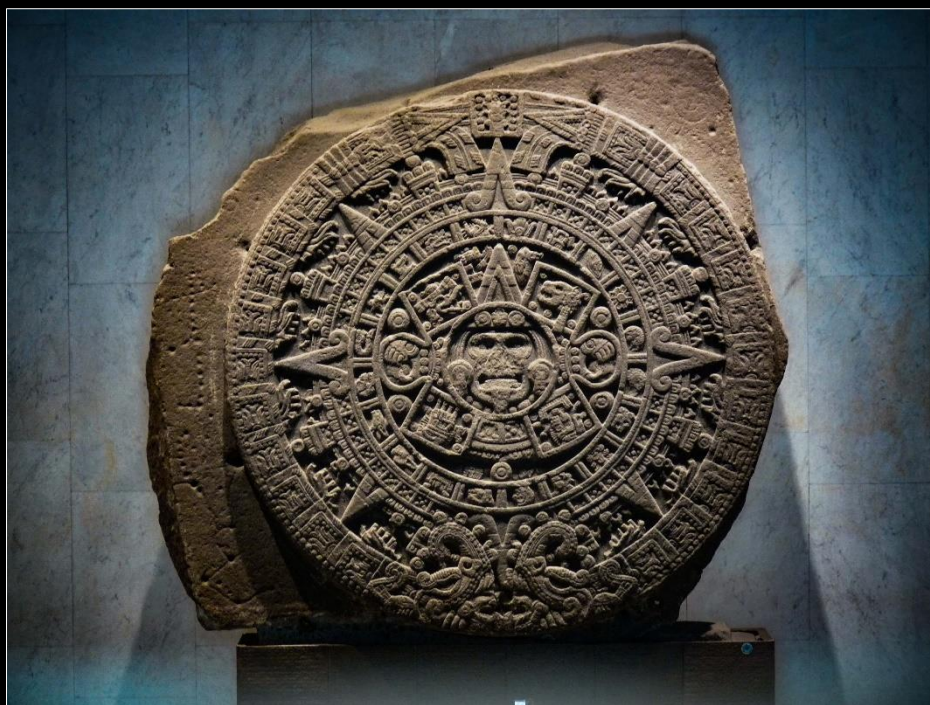
"La Pierre du Soleil"