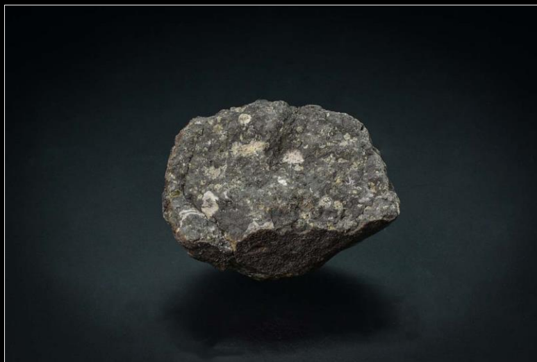
"La météorite Allende"

Bord du cadran : la météorite d'Allende, l'origine du temps